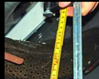
Måling av ryggbredde på voksen hunderørret.