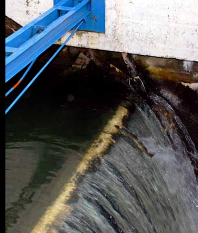
Her må det briste eller bære. En vinterstøing kaster seg baklengs utor fossen i et desperat forsøk på å komme seg ned til Mjøsa.

og nedstrøms til Gausdalsarm-brua (Rv 255).