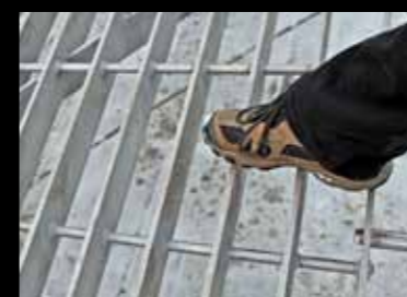
Foten med sko str. 44 viser størrelsen på glippene i den nye turbinristen.