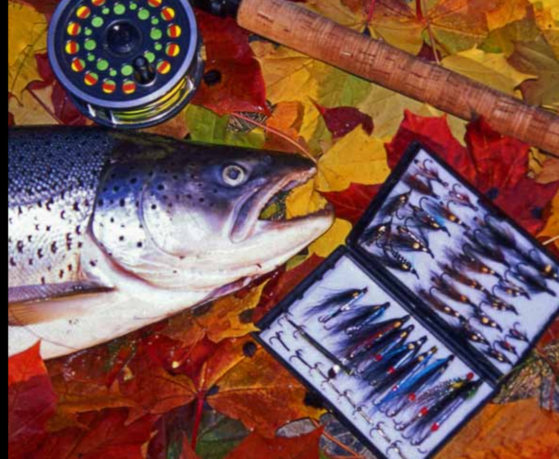
En storørret har tatt sin siste flue en vakker høstdag.