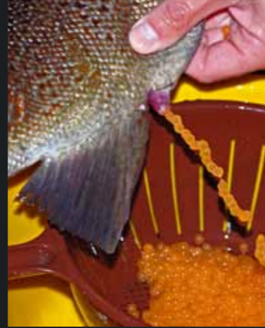
Skånsom stryking av hunderørreten. Klimaendringer påvirker gytingen og svekker energien i rognkornene.