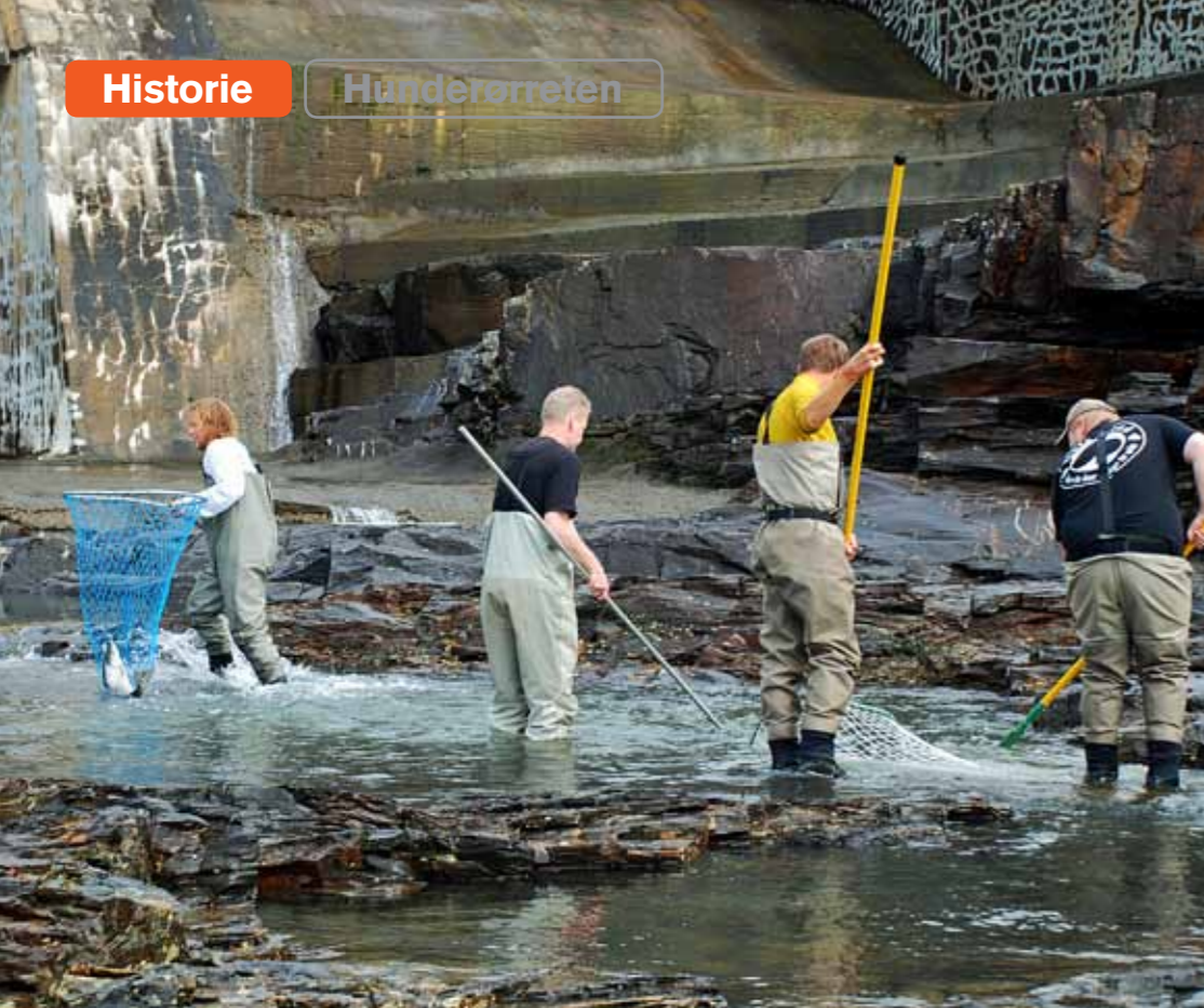
Ørretjakt med håv under flomluken, men det genetiske opphavet til stamfisken bekymrer forskerne.