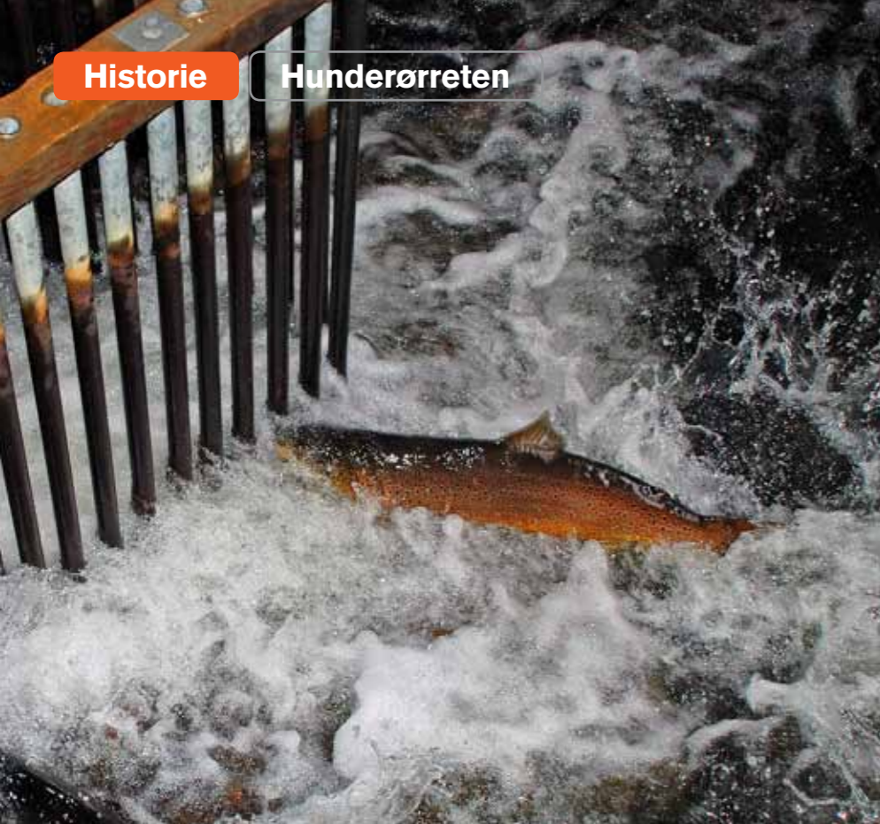
Hunderørret hopper mot fiskefella. Her er det ikke lett å komme videre.