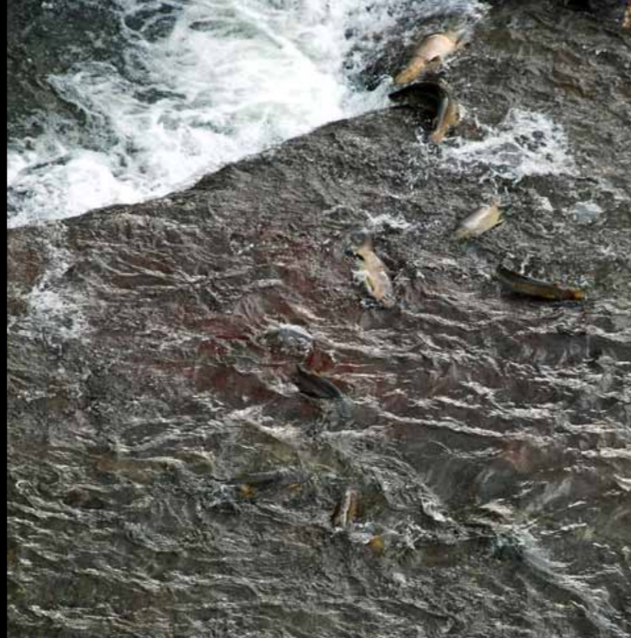
Et tragisk syn. Her har flere ørreter strandet i østre løp under demningen.