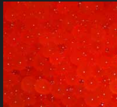
Et bøtte rogn som forhåpentlig skal bli nye hunderørreter.