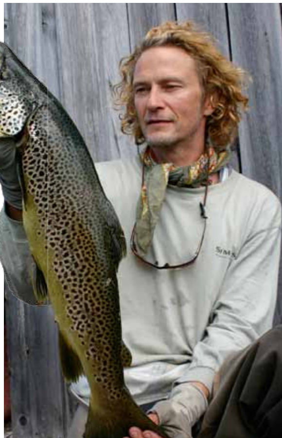
MIDDAG: En fantastisk fisk og en fantastisk opplevelse